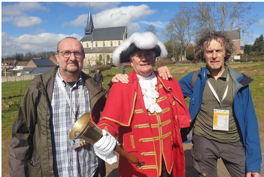
De Belleman was ook aan de rustposten present.

Katrien Claus was een van die gemotiveerde stappers die in de late namiddag op de Markt in Geraardsbergen aankwam. “We vertrokken om 6.15 uur in Brussel met enkele vrienden. Een tof parcours, hier en daar flink wat modder, maar dat deerde niet. De sfeer zat er onderweg goed in. De voorspelde regen bleef uit en we genoten aan de supergeorganiseerde rustposten onderweg.”